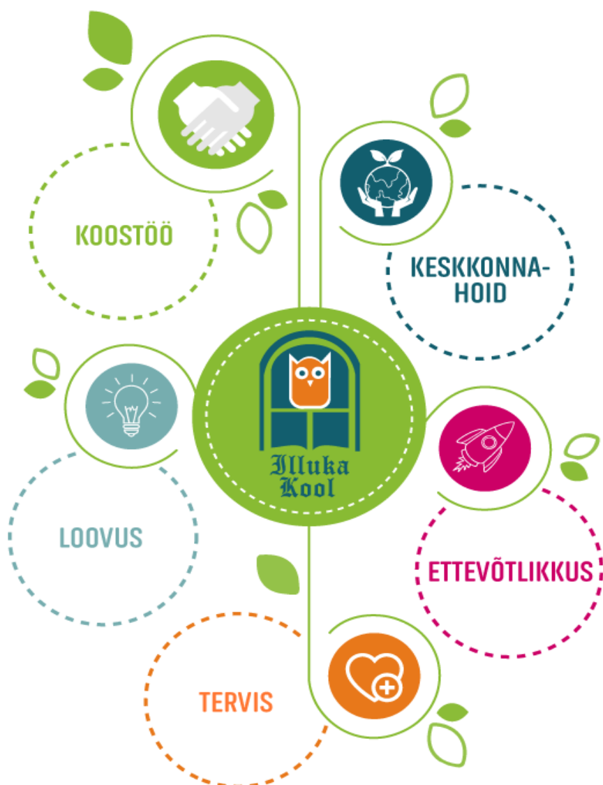
Joonis 1. Illuka Kooli väärtused