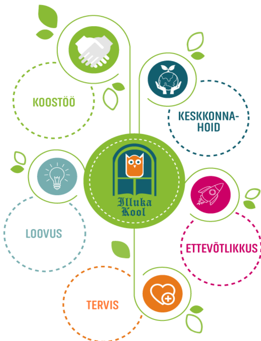
Joonis 1. Illuka Kooli väärtused